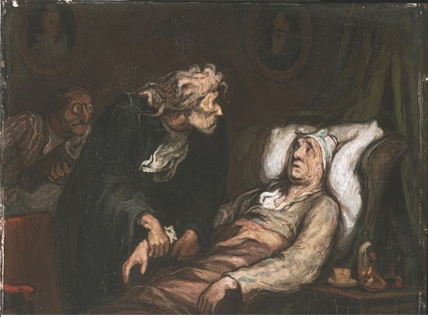
Image: Le Malade Imaginaire vu par H.Daumier

Le Malade Imaginaire , dernière comédie de Molière a été jouée pour la première fois le 10 février 1673 au Théâtre de la salle du Palais Royal, à Paris. A la